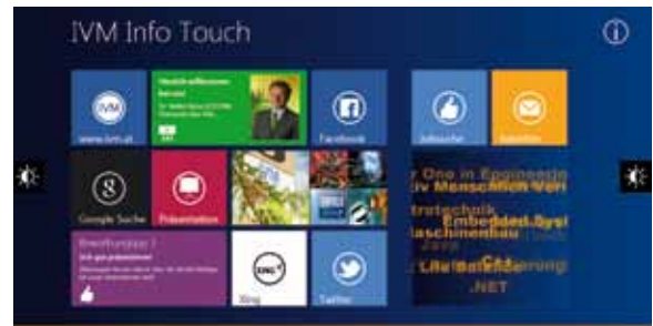
Die IVM Info Terminals (HTML5, CSS 3, JavaScript, PHP, MySQL), entstanden aus einem Praktikumsprojekt

Bewerben Sie sich früh genug - wir vergeben die Praktikumsplätze für den Sommer bereits im Februar/März des Jahres.